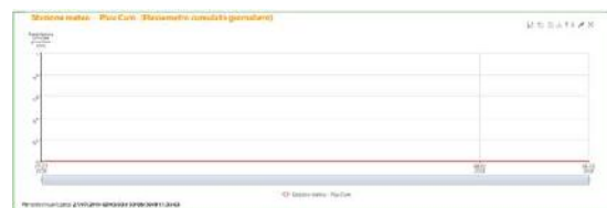
Stazione meteo – Pluviometro Az. Agricola Pasquini