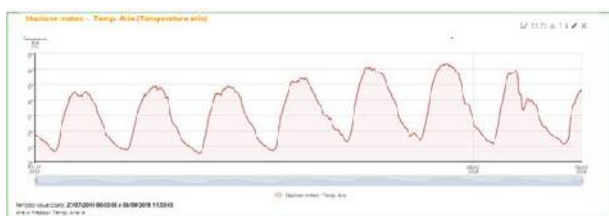
Stazione meteo - Temperatura aria Az. Agricola Pasquini

Sulla base dei dati rilevati per il parametro piovosità nelle due stazioni meteo nel periodo considerato dal 27 luglio al 3 agosto si possono fare le seguenti considerazioni: in loc. San Giovanni nell'azienda Pasquini non sono state rilevate piogge, mentre nel Podere di Fontecornino a Montepulciano sono caduti poco più di 1,25 mm in data 2 agosto. In considerazione delle precipitazioni pressochè nulle, si raccomanda pertanto di effettuare irrigazioni sulle culture in corso con particolare attenzione a quelle orticole che sono in fase di ingrossamento frutti o in pre-raccolta e a quelle frutticole sulle quali si consiglia l'apporto idrico tramite ali goccialanti che evitano la bagnatura delle foglie.