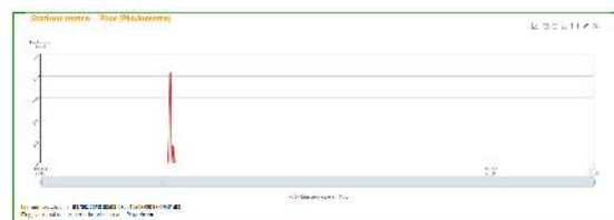
Stazione meteo – Pluviometro Az. Agricola Pasquini